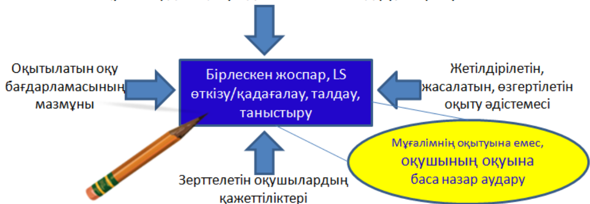
2-сурет. Lesson Study қағидастары